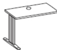
Ala de mesa

180 x 80 x 74 cm 160 x 80 x 74 cm 140 x 80 x 74 cm 120 x 80 x 74 cm 102 x 80 x 74 cm